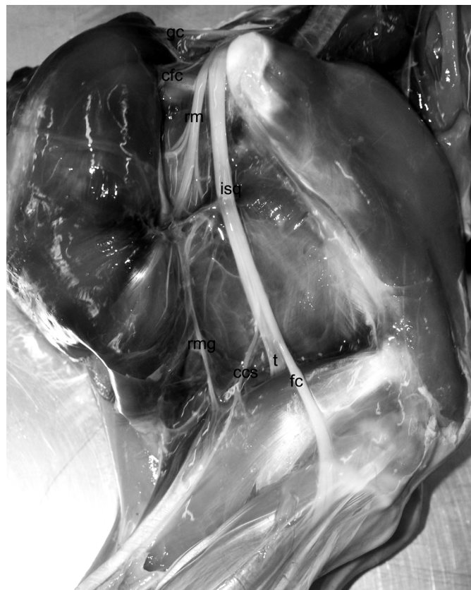
Fig.3. Vista lateral do membro pélvico do veado-catingueiro em que o nervo isquiático (isq) emite os nervos glúteo caudal (gc) e cutâneo femoral caudal (cfc), sequencialmente emite ramos musculares (rm) que suprem os músculos adutor, semimembranoso, bíceps femoral e o gastrocnêmio (rmg). O nervo isquiático (isq) bifurca-se em nervo tibial (t) e nervo fibular comum (fc), do qual se originou o nervo cutâneo caudal da sura (ccs).

mo a tuberosidade calcânea o n. tibial dividiu-se em nervo plantar lateral e medial, os quais seguiram, respectivamente, para a região planto-lateral e médio-plantar do tarso.